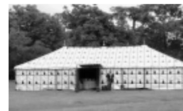
conception graphique : Perlette, Lyon